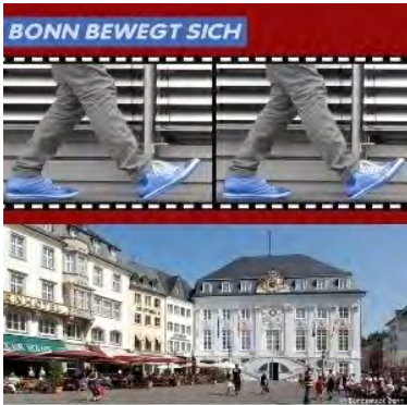
Ratsbilanz CDU & GRÜNE 2014

Die Koalition hat einen umfangreichen Rechenschaftsbericht über ihre erfolgreiche Ratsarbeit verfasst, der auf der Bilanz-Homepage www.bonn-bewegt-sich.de einzusehen ist und dort auch um Download bereit steht.